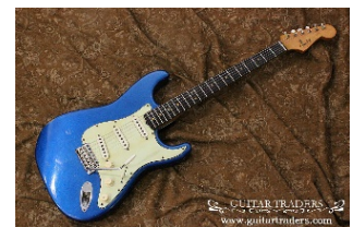
Fender ストラトキャスター 1963 年