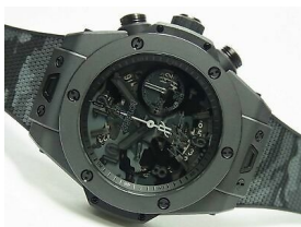
HUBLLOT ビッグ・バン オールブラック カモ ヨウジヤマモト (日本限定 100 本)