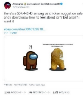
オークションに言及した 『Among Us』公式 Twitter のツイート