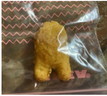
US$99,997 (約 1,100 万円) で落札された 『Among Us』のクレー型チキンナゲット (BTS とマクドナルドのコラボレーションミール)