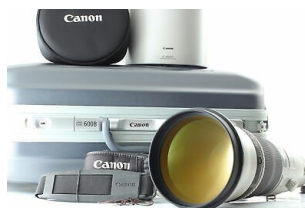
Canon EF600mm F4L IS II USM 超望遠レンズ