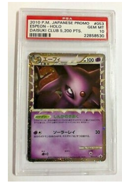
日本から US$9,000 (約 99 万円) で取引されたポケモンカード 「PCG アクションポイント スペシャルランク プレゼントカード エーフィ」