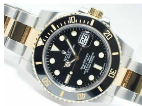
ROLEX サブマリーナデイト 116613LN